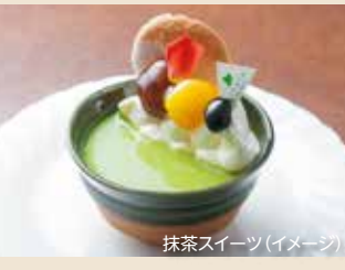
抹茶スイーツ(イメージ)

■1室あたり大人2名様以上でお申し込みください。●表示の大人旅行代金は「1室利用人員」あたりの1人様あたりの代金表示です。子供旅行代金は、大人2名様以上同行(3名以上1室利用)の場合に適用いたします。1室につき、大人1名+子供1名でお申し込みの場合の子供代金は、大人と同額となります。●子供代金は原則として6歳以上12歳未満(小学生)のお子様及び宿泊施設での寝具、食事等のご利用を希望される未就学児のお子様に適用されます。●幼児のお子様で、寝具、食事を利用されない場合でも「幼児施設使用料」等が必要となる場合がございます。