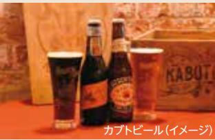
カプトビール(イメージ)

出発日／平成30年9月7日～平成31年3月15日、毎週金曜日出発 (除外日平成30年11月2日・12月28日、平成31年1月4日及び施設臨時休業日は除く) 集合場所・時間／名鉄・常滑駅(8:30発／17:30頃着)、名鉄・知多半田駅(9:00発／17:00頃着)、 名鉄・碧南駅(11:00発／16:50頃着)、名鉄・西尾駅(9:00発／17:00頃着)