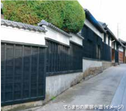
てらまちの黒塀小道(イメージ)

出発日／平成30年9月7日～平成31年3月15日、毎週金曜日出発 (除外日平成30年11月2日・12月28日、平成31年1月4日及び施設臨時休業日は除く) 集合場所・時間／名鉄・常滑駅(8:30発／17:30頃着)、名鉄・知多半田駅(9:00発／17:00頃着)、 名鉄・碧南駅(11:00発／16:50頃着)、名鉄・西尾駅(9:00発／17:00頃着)