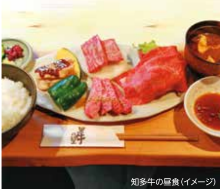
知多牛の昼食(イメージ)

出発日／平成30年9月7日～平成31年3月15日、毎週金曜日出発 (除外日平成30年12月28日、平成31年1月4日及び施設臨時休業日は除く) 集合場所・時間／名鉄・常滑駅(9:20発／17:10頃着)、名鉄・知多半田駅(8:50発／16:50頃着)、 名鉄・碧南中央駅(8:30発／17:00頃着)、名鉄・西尾駅(8:20発／17:20頃着)