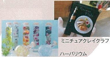
ミニチュアクレイクラフト