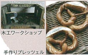
木工ワークショップ