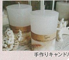
手作りキャンドル

※参加人数、体験料などは半田赤レンガ建物ホームページをご覧ください。※事前予約も受付いたします。TEL0569-24-7031まで